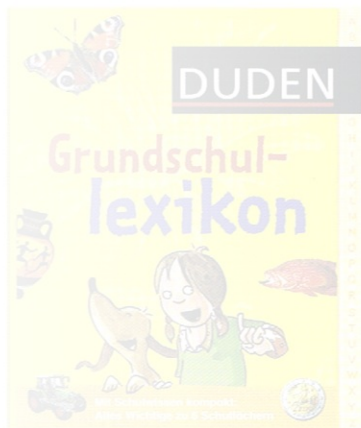
Das Grundschullexikon für kleine Schlaumeier.

Das Grundschullexikon für kleine Schlaumeier soll die Welt gemeinsam lernen. Es sollen kinderfreundlich in alle Bereiche verschaffen. Das hilfreich ist das Schulwissen. Hier sind Fachbegriffe grundlegende in den wichtigsten Bereichen auf einen Blick. Das gebunden vermittelt auf