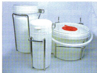
Je nach Größe werden die Halter zwischen 12,95 und 19,95 Euro verkauft.