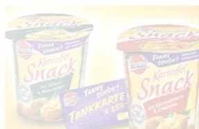
Pfanni Kartoffel Snacks im Becher.

Die Verbraucher finden unter allen Deckeln der Pfanni Kartons im Becher. Unter jeder Siegelolie ist ein Code eingegeben, den Verbraucher auf www.pfanni.de eingeben können. Zudem auf der Pfanni Website Graticodes. Der empfohlene Verkaufspreis für ein 300 g fertiges Produkt wird mit 0,99 Euro angegeben.