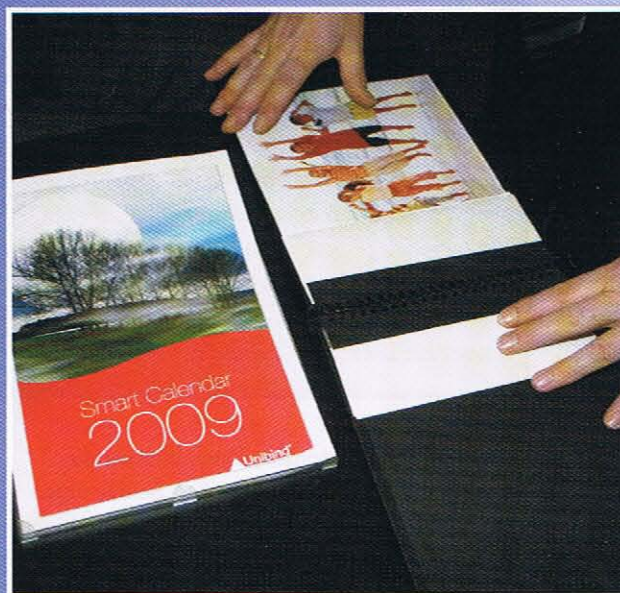
Schnell gefüllt: Der Unibind Smart Calendar. Unten: Gelaserte Fliesen (Trotec).