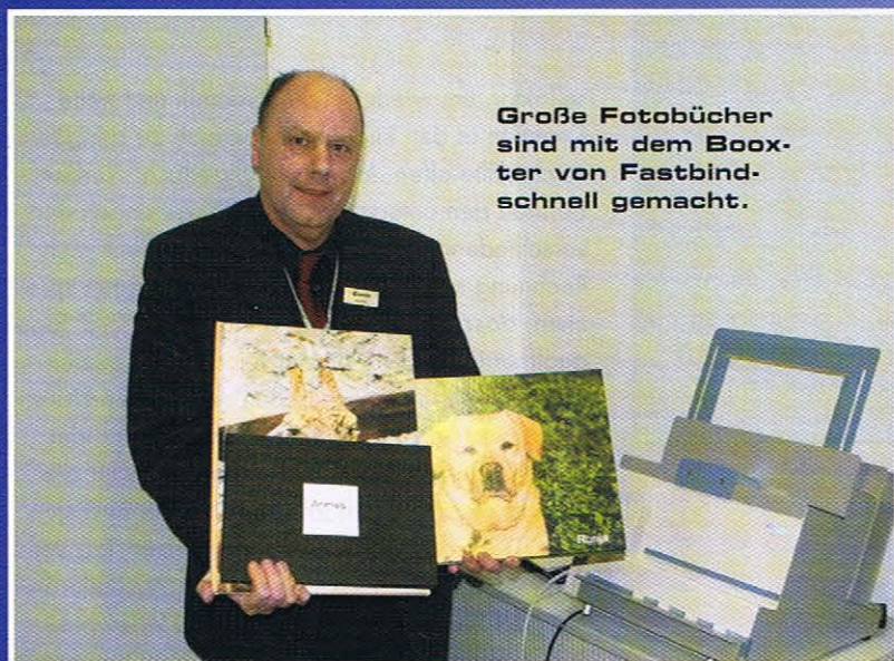
Große Fotobücher sind mit dem Book-ter von Fastbind-schnell gemacht.